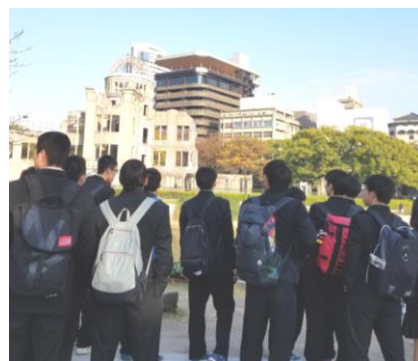
広島市 原爆ドームにて

2学年では、この修学旅行を節目として受験へと意識を向けるように、12月4日(月)に学年集会を行い、受験生としての第一歩を踏み出しました。