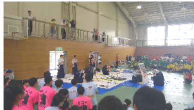
書道部によるパフォーマンス