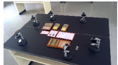
自然科学部による展示発表