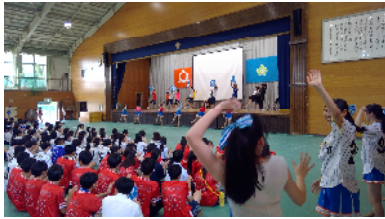
応援団チアリーディング部の発表

7月19日(水)に磐城高校アゼンブリーが開催されました。磐城高校アゼンブリーとは磐城高校生徒会が主催し、文化部などの発表の場をつくることで、活動の活性化を目指した行事です。全体会場となる南体育館では応援団チアリーディング部による発表や書道部によるパフォーマンス、演劇部による発表、合唱部や吹奏楽部による演奏などが行われ、普段はあまり見るのできない文化部によるレベルの高いステージに大いに盛り上がりました。また、南体育館以外の校内発表や展示でもそれぞれの文化部が趣向を凝らした発表や展示を行い、互いの活動や活躍に触れる良い機会になりました。