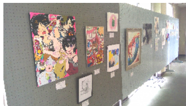
美術部による作品展示