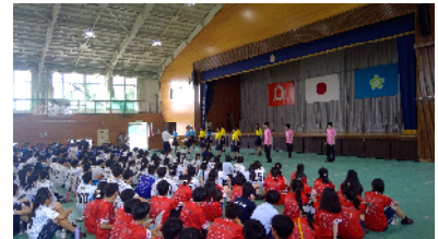
合唱部による演奏