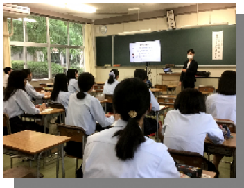
昨年度の医療フェスの様子