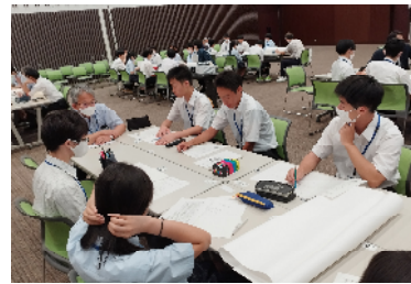
ゼミでの講義や討論の様子