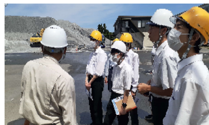
各施設での体験へ先着の様子