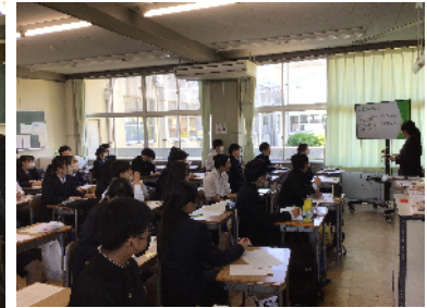
3年生による発表の様子